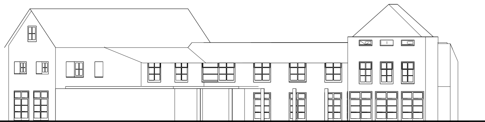
gevel aan Burgemeester Hagelaan schaal 1 : 200