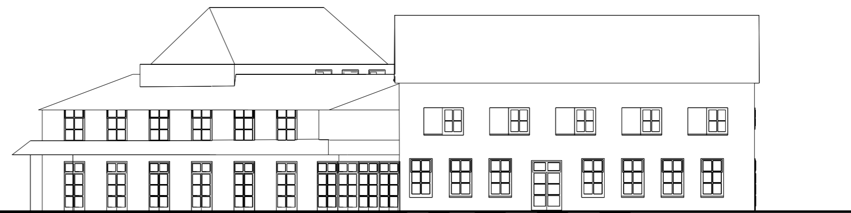
gevel aan Dorpsweg/ Nieuwstraat schaal 1 : 200